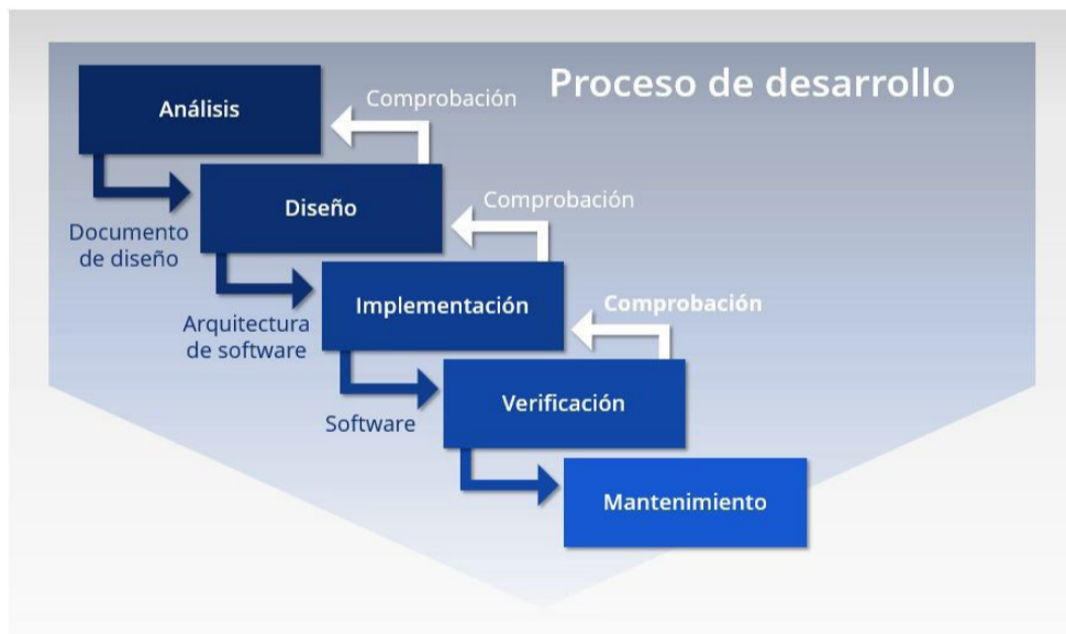
Figura 1. Fases del modelo en cascada para el desarrollo de software. Elaboración propia

Cada una de las fases consiste en lo siguiente: