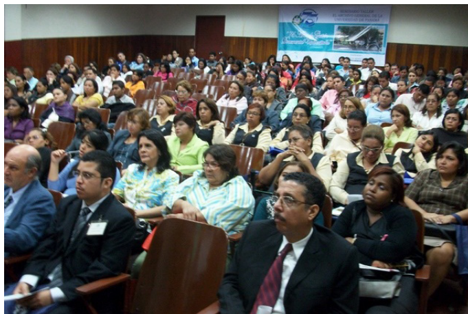
“75 Años de gestión documental universitaria”, Universidad de Panamá 2010.

Por su parte, la cooperación de la UAH con la Universidad de Panamá comenzó con una visita de varios responsables económicos de la UAH a la UP. Poco después un arquitecto de la UAH asesoró para la elaboración de los planos del Archivo General Universitario UP. Aprovechando la celebración del 75° aniversario de la fundación de la Universidad de Panamá, la UAH realizó una exposición sobre la historia y el patrimonio complutenses, además de visitas a servicios y altos cargos, y un seminario sobre archivos y patrimonio documental.