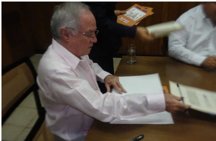
Firma del convenio por los Rectores

Otras instituciones mostraron interés en formar parte, como la Universidad Tecnológica del Contador Público Autorizado de Panamá, la Universidad Tecnológica de Panamá y la Universidad Señor de Sipán de Perú. El convenio en su cláusula tercera contempla la posibilidad de futuras incorporaciones mediante la firma de un acuerdo de adhesión.