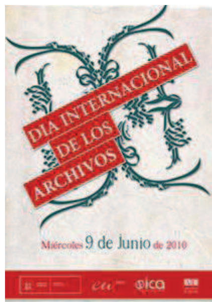
Carteles del Día Internacional de los Archivos 2008 y 2010

La fecha de 9 de junio se decidió por votación en la Conferencia General Anual que tuvo lugar en Québec, Canadá, en noviembre de 2007, y se celebra desde el año 2008 para promover el valor de los Archivos al servicio de la investigación, la cultura, la memoria histórica y la transparencia ante los ciudadanos. En países tan distantes como Japón, Hungría, Senegal y muchos otros se realizaron actos simultáneos de celebración.