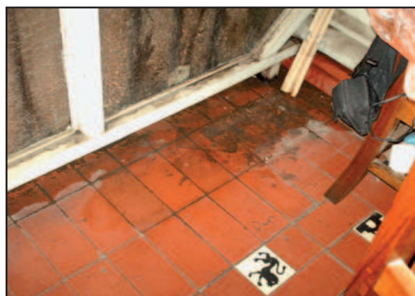
Filtración de agua

Fue entonces que se elaboró y presentó el Proyecto de Conservación y Preservación del AHML 1710-1956, que proponía la limpieza técnica en seco de estos documentos y la guarda adecuada, el cual fue aprobado tres meses después. Dicho proyecto planteaba como primer paso, el traslado del Archivo a un depósito en donde tuviera mayor seguridad, para ello se delegó a una persona responsable de su conservación y su guarda.