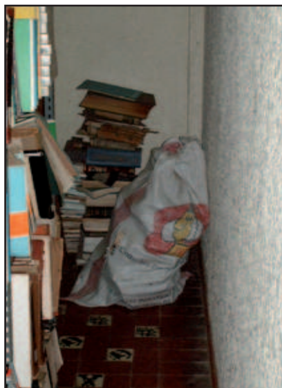
Restos de basura de papeles y libros en el piso

Ante esta información que se le brindó al Dr. Sampson y al ver las condiciones en las que estaban “guardados” los documentos (un depósito que era bodega con malas instalaciones eléctricas, filtración de agua y polvo, mobiliarios en mal estado, sacos de basura, etc.) él se preguntó “¿Qué podemos hacer para rescatar estos documentos? Es necesario elaborar un proyecto que nos permita conservar y poner a la disposición de la comunidad estos documentos de gran valor”.