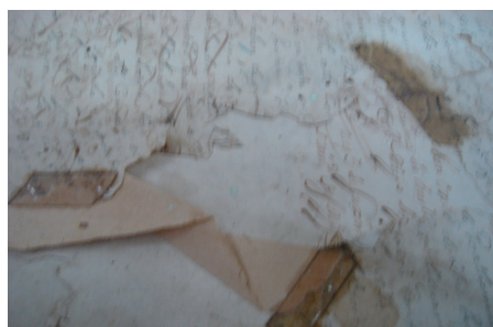
Manchas de cintas adhesivas