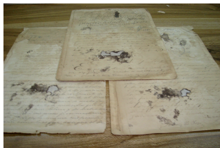
Moho y bacterias

* Química Especialista en Conservación y Preservación Documental