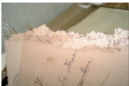
Daño ocasionado por roedores

En las siguientes fotografías podemos apreciar el daño provocado por algunos de los factores antes mencionado