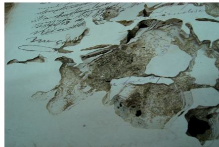
Daño por polilla